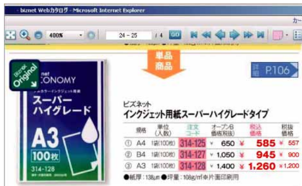
お客様企業ごとのご契約価格を紙面イメージ上に表示