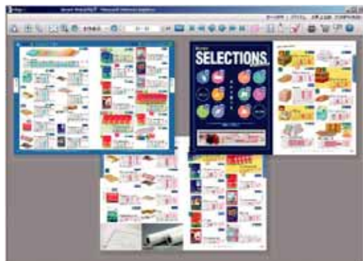
複数カタログやチラシを同時に表示できる 「マルチビューアー」